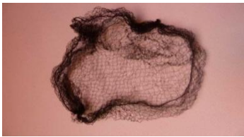
Filet à chignons

1 : Commencer par faire une queue de cheval bien au milieu. (Les cheveux doivent être bien tirés avec du gel et / ou de la laque fixation forte et aucune mèche ne doit dépasser).